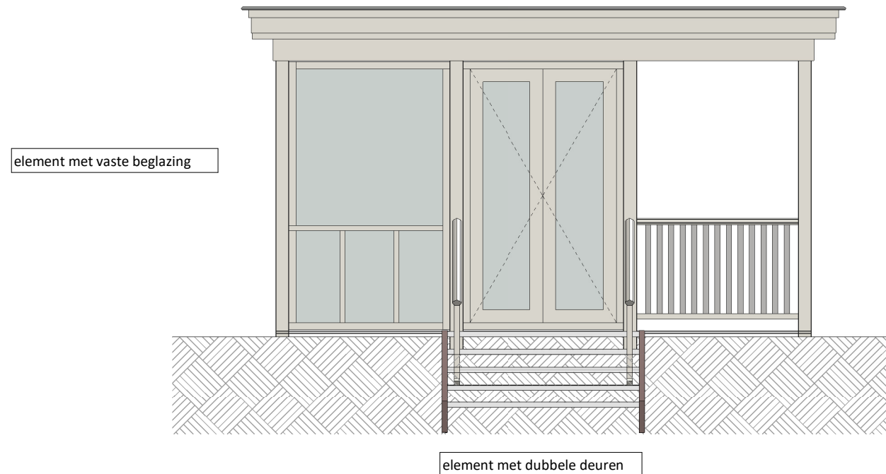
dichtzetten porch optie 17