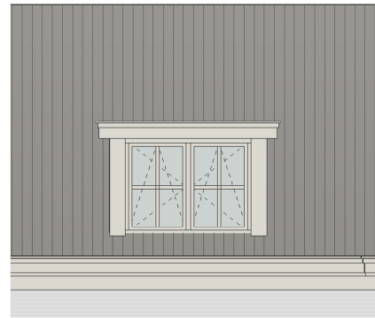
Optie 2 dakkapel met kozijn breed 1.90m