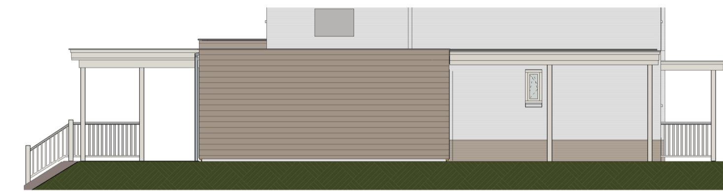
Linker zijgevel optie 5 Schaal: 1 : 100