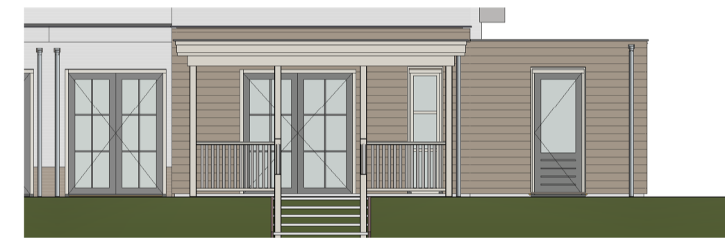
Achtergevel optie 10 Schaal: 1 : 100