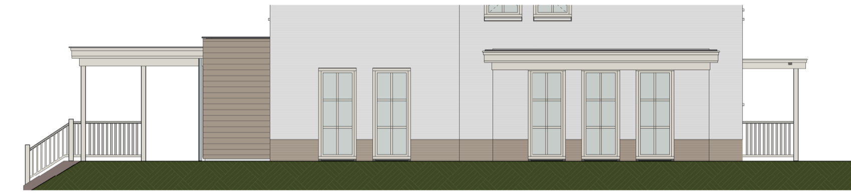
Linker zijgevel optie 10