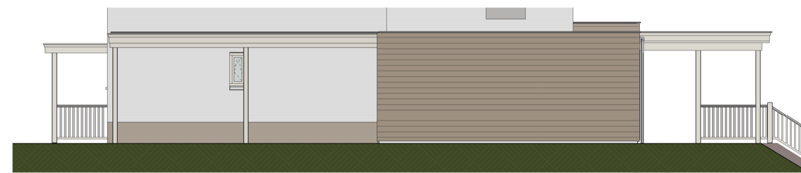
Rechter zijgevel optie 4