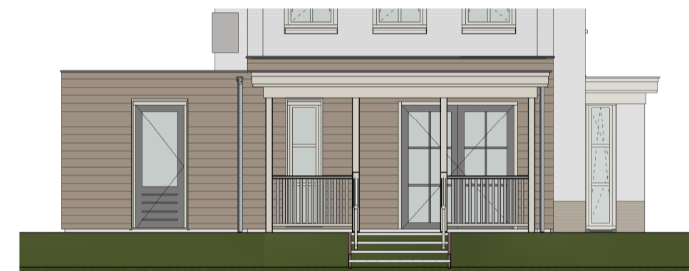
Achtergevel optie 10